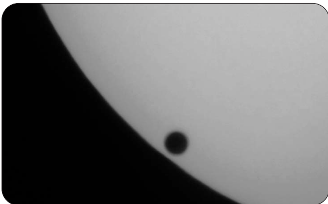
Vénus devant le soleil.

Vénus est une planète semblable à la Terre sur certains points. Sa taille par exemple est sensiblement la même, Vénus étant environ 9/10 e de la Terre. De plus, c'est aussi une planète rocheuse avec une composition semblable. Mais les comparaisons s'arrêtent à peu près là car Vénus est une véritable fournaise. Il y fait plus de 460 degrés celsius en moyenne et c'est définitivement la planète la plus chaude du système solaire. Il y pleut de l'acide sulfurique et l'atmosphère est surtout composée de gaz carbonique (CO 2 ). Si vous y planifiez un voyage, commencez déjà à chercher un parapluie très résistant. La surface de Vénus est toujours cachée sous un épais manteau de nuages et le terme "manteau" est bien adapté, notamment parce que la température est relativement uniforme, que l'on soit aux pôles ou à l'équateur, ou bien sur son côté « jour » que dans sa « nuit ». Ce manteau est en quelque sorte la principale raison expliquant la température élevée qui y règne. Tout un exemple d'effet de serre ! Et pour couronner le tout, la pression atmosphérique y est environ 100 fois plus forte qu'ici sur Terre, soit l'équivalent de la pression d'eau sous 1000 mètres de profondeur.