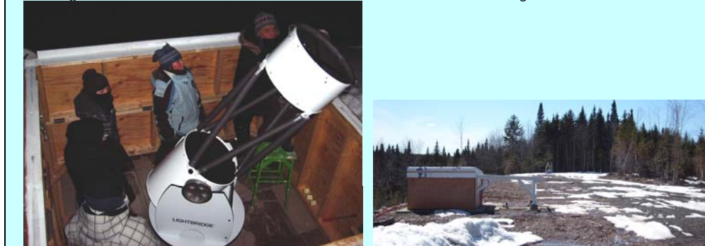
2 autres images de l'observatoire accessible aux membres du club.