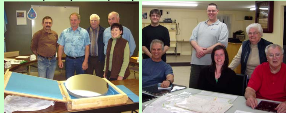
Présentation du miroir de 500mm (20”) de diamètre acquis en mai 2009 grâce à l'aide financière de la municipalité, de la caisse populaire de la rivière du sud et de généreux donateurs. On aperçoit sur la photo 5 membres du conseil municipal posant fièrement derrière le miroir.