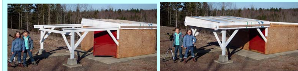
2 images de l'observatoire accessible aux membres du club; toit fermé à gauche et ouvert à droite.