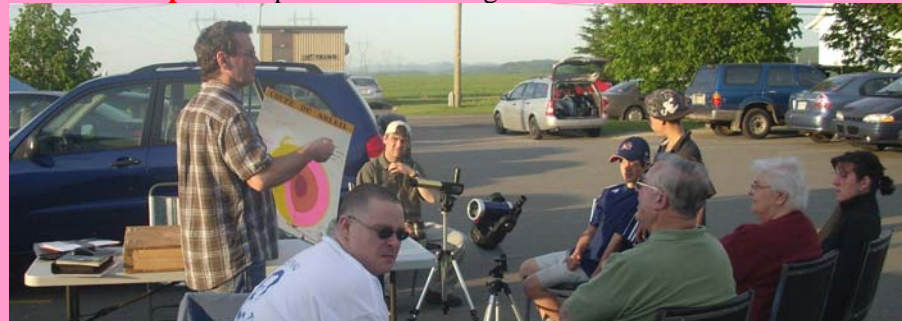
Cours d'initiation du 5 juin 09 en plein-air avec observation du Soleil

E) Possibilité de participer à la réalisation de notre deuxième observatoire qui abritera un télescope de 500mm (20 pouces) d'ouverture (tube optique a été acquis le 23 mai 2009, financement en cours) avec comme but avoué d'en faire un observatoire public à plus ou moins long terme.