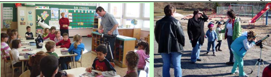
Image de gauche: visite à la maternelle de Berthier sur mer-mars09

Membre de la Fédération des astronomes amateurs du Québec (FAAQ)